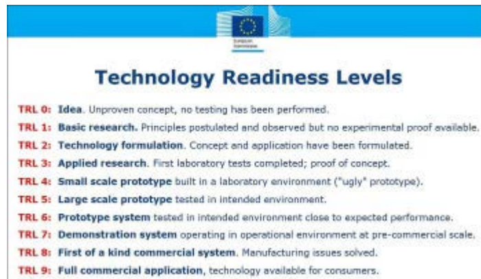
Escala de TRL de la Comisión europea

Cualquier proyecto que proponga soluciones de desalación no existentes en el mercado y con un grado de desarrollo TRL (nivel de madurez del producto), preferentemente entre 3 y 8 (consultar escala de TRL abajo).